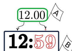
Рис. 1: Пример асинхронного сбоя (устаревшие данные помечены красным контуром)

Труды 15-й Всероссийской научной конференции «Электронные библиотеки: перспективные методы и технологии, электронные коллекции» — RCDL-2013, Ярославль, Россия, 14-17 октября 2013 г.