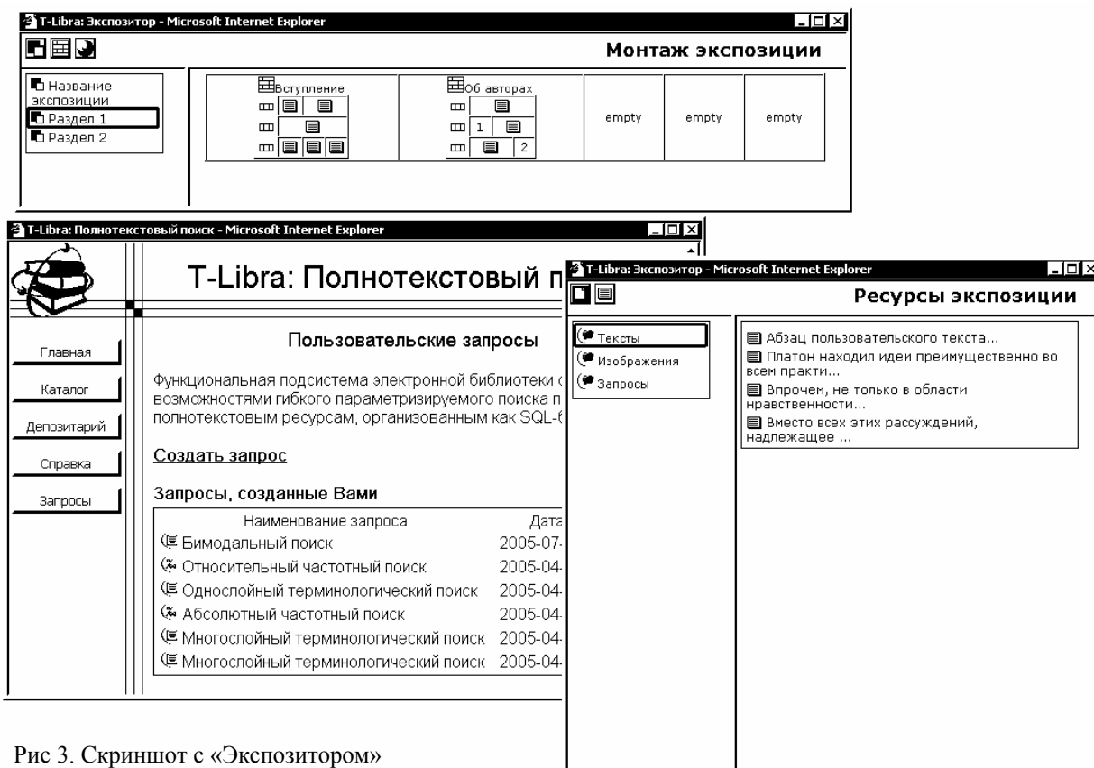
Рис 3. Скриншот с «Экспозитором»

4.2.3. Тематическая экспозиция может быть составлена не только «ручным» путем, но и в автоматизированном режиме.